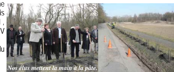
Nos élus mettent la main à la pâte.

La cinquième édition de la route du Louvre a eu lieu le dimanche 16 mai 2010.